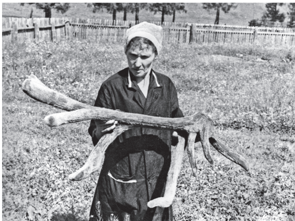
Огромную роль в развитии мараловодства на Алтае играли женщины.