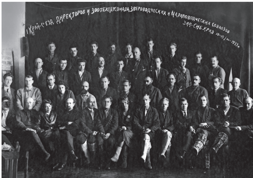
Материалы Музея алтайского марала (г. Бийск)