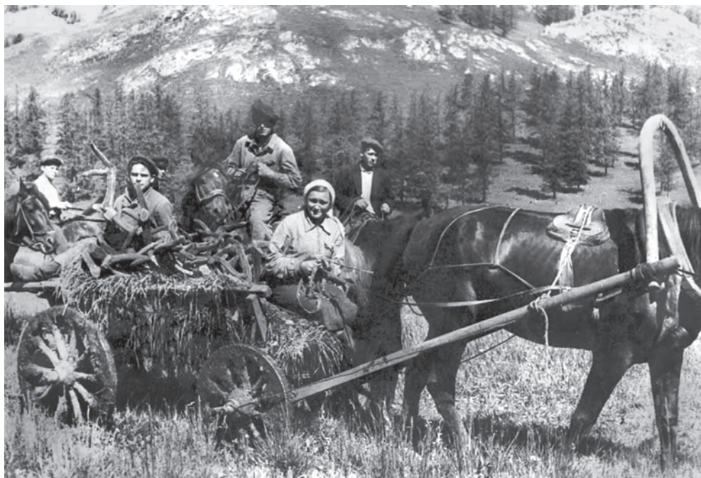
Мараловоды Ново-Талицкого маралосовхоза.